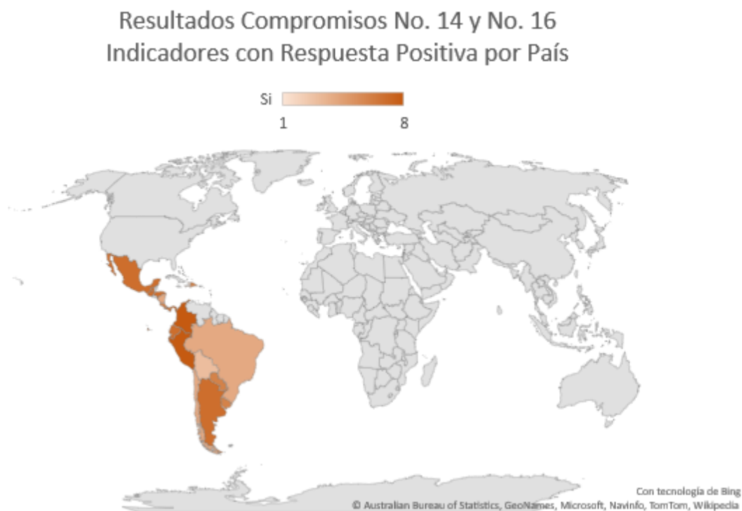
Gráfica 1. Resultados Compromisos No. 14 y N. 16. Indicadores Normativos con Respuesta Positiva por País